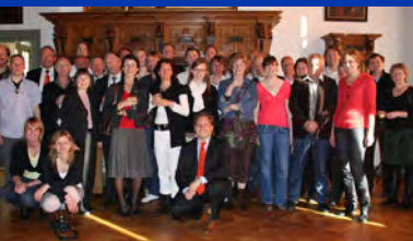
BC Duinwijk: Een Up-To-Date vrijwilligersbeleid