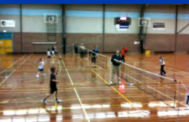
Opstapcompetitie in Noord-Holland