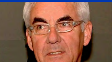
RBB en Badminton Nederland gaan samen door