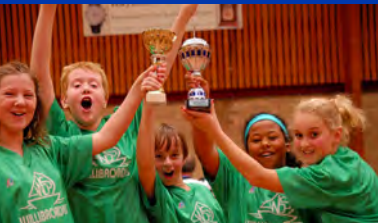
Schoolbadminton in Grootebroek