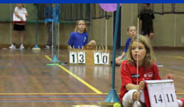
Yonex Kids Games in Groningen