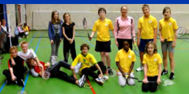
'Opstappen' bij BV Doesburg