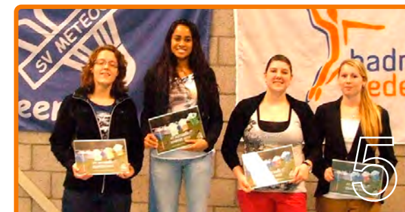
Succesvol SV Meteor toernooi