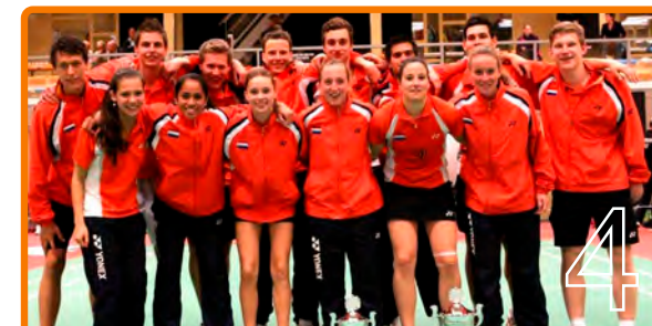
Traditie in ere hersteld