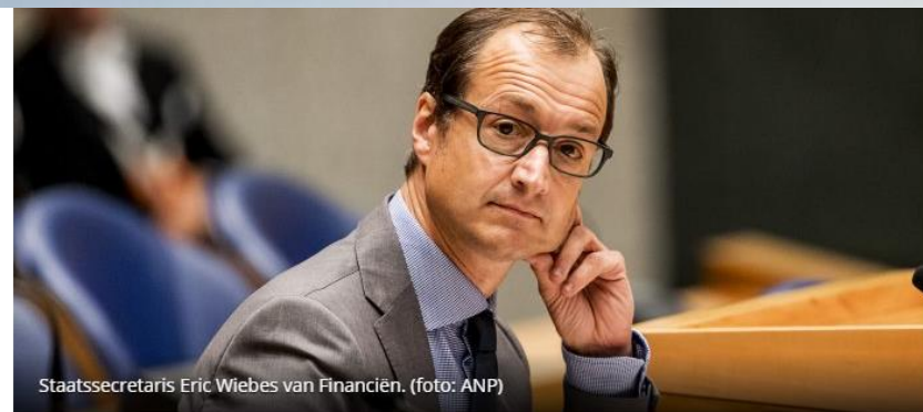
Staatssecretaris Eric Wiebes van Financiën.

Hij signaleert dat werkgevers liever kiezen voor een professional die werkt vanuit dienstverband dan voor een zzp'er. Dit heeft alles te maken met de invoering van de Wet Deregulering Beoordeling Arbeidsrelaties (DBA) op 1 mei. Opdrachtgevers blijken niet lichtzinnig hun handtekening te zetten onder modelovereenkomsten om hun arbeidsrelatie met zzp'ers te bekrachtigen.